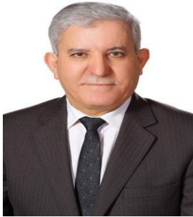
عطوفة أ.د فواز الزغول مدير المجلس العربي- الجامعة الأردنية