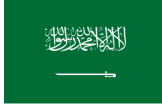
جامعة الأمير محمد بن فهد