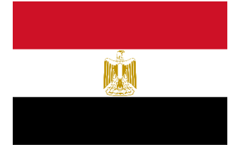
جامعة مصر للعلوم والتكنولوجيا