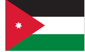
المملكة الأردنية الهاشمية

جامعة المنوفية جامعة طنطا جامعة الزقازيق جامعة مصر للعلوم والتكنولوجيا معاهد العبور العالي أكاديمية الشروق جامعة بنها جامعة الفيوم الأكاديمية العربية للنقل البحري جامعة أسيوط جامعة ميريت جامعة سفنكس