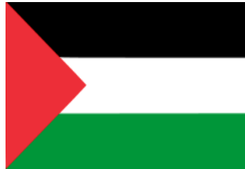
جامعة القدس المفتوحة