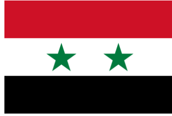
الجمهورية العربية السورية

جامعة العلوم الطبية والتكنولوجيا جامعة الخرطوم