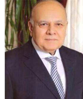
معالي ا.د عمرو عزت سلامة الأمين العام لإتحاد الجامعات العربية