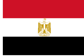
جمهورية مصر العربية

جامعة القدس المفتوحة جامعة بيرزيت جامعة النجاح الوطنية جامعة فلسطين التقنية-خضوري جامعة بولتكنيك فلسطين الجامعة العربية الأمريكية