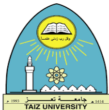
جامعة تعز الجمهورية اليمنية