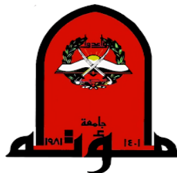
جامعة مؤتة المملكة الأردنية الهاشمية