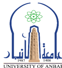
جامعة الأنبار جمهورية العراق